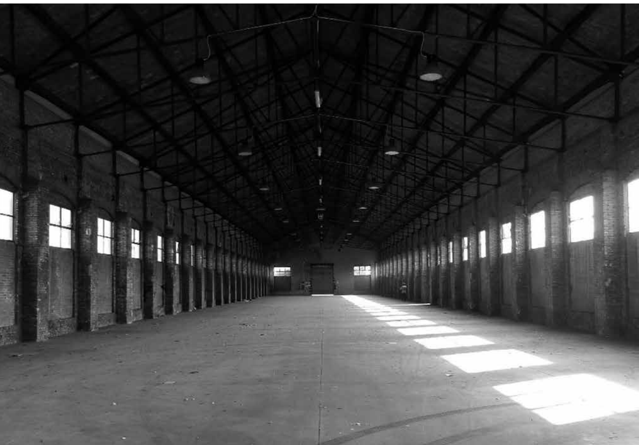
Fig. 2 – Ex scalo merci Ravone, Bologna. La prospettiva interna di un magazzino abbandonato esprime efficacemente il suo potenziale a conseguire risultati inediti. Per effetto della crisi finanziaria la valorizzazione dell'intera area non è mai iniziata, condannando gli immobili a precipitare in un provocatorio paesaggio di rovine. Noncurante dell'insussistenza delle condizioni al contorno, nel 2015 il Piano Operativo Comunale ha legittimato il destino del comparto a diventare un quartiere urbano ad alta densità.