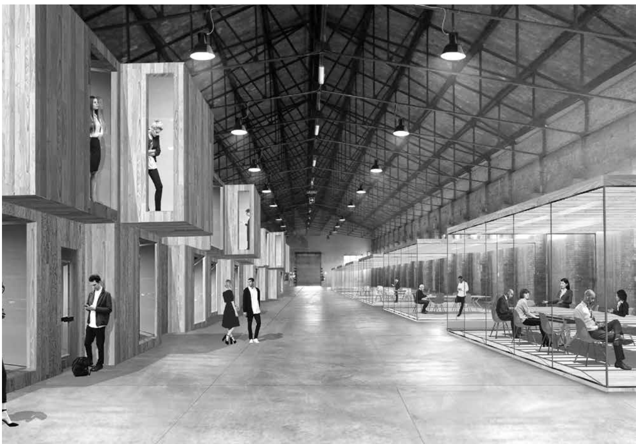
Fig. 3 – Ex scalo merci Ravone, Bologna. La riattivazione degli spazi con usi temporanei, affermando la funzione sperimentale dell'architettura intesa come prassi, può contribuire a prefigurare scenari alternativi, conformandoli alle reali esigenze della città e suggerendo orizzonti di opportunità che la logica del Piano non è strutturalmente in grado di concepire. Superate le iniziali resistenze della politica, che confermano l'alleanza con le leggi della finanza, l'area è finalmente pronta

oggi per un progetto sperimentale di innovazione socio-economica, voluto da Comune e Regione Emilia-Romagna come caso pilota di rigenerazione urbana. Committente FS Sistemi Urbani; Progetto: Studio PERFORMA A+U.