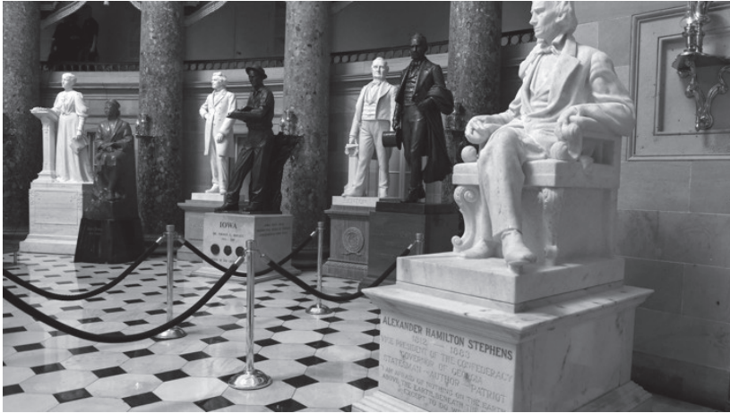
Fig. 3. Marmo di Alexander Stephens, vicepresidente della Confederazione sudista, National Statuary Hall, Washington DC, https://www.theatlantic.com/politics/archive/2017/08/confederate-statues-congress/536760/

le statue precedentemente inviate con altre di personaggi ritenuti più rappresentativi in quel momento. Ma gli eroi confederati sono rimasti quasi tutti al loro posto 22 .