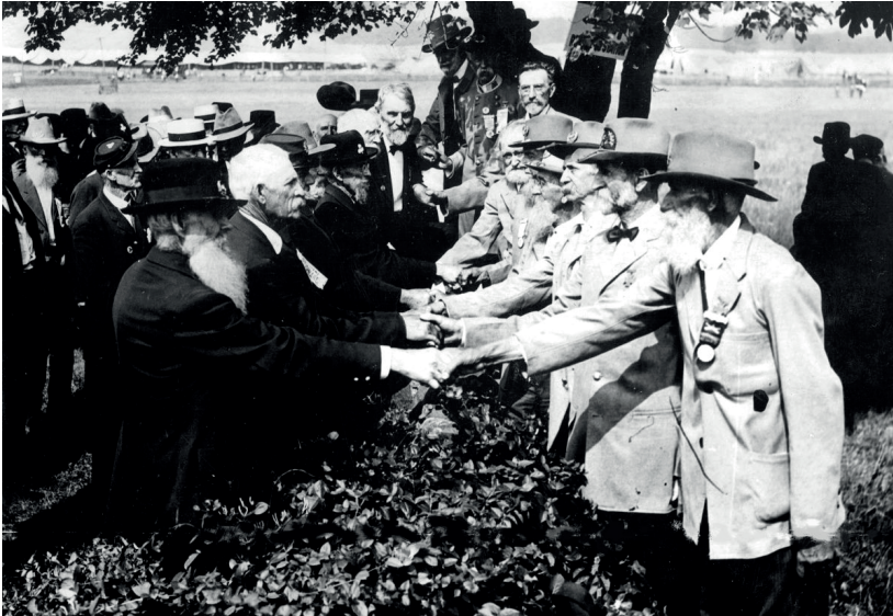
Fig. 4. Cinquantenario della battaglia di Gettysburg, reduci della Confederazione e dell'Unione si incontrano a Cemetery Ridge, 1913

alla sconfitta nella Guerra Civile, creando un'immagine della guerra come un'impresa epica eroica. Uno dei temi più importanti del culto della Causa Perduta era lo scontro di due civiltà, una inferiore all'altra. Si diceva che il Nord, invigorito dalla lotta costante con la natura, era diventato materialista, alla ricerca costante di ricchezza e potere, mentre il Sud, grazie al clima più benevolo, aveva realizzato una società più raffinata. Eroi tragici, i sudisti avevano sostenuto una lotta nobile ma condannata in partenza per preservare la loro civiltà superiore. C'era un elemento cavalleresco nel modo in cui il Sud aveva lottato, ottenendo alcune vittorie valorose nonostante l'inferiorità dei mezzi. Questa era la Causa Perduta, come era vista a fine Ottocento e generazioni di sudisti si predisposero a glorificarla e celebrarla. Forse la manifestazione più significativa di "riconciliazione" tra reduci del Nord e del Sud, "fratelli bianchi" che avevano combattuto su fronti opposti, fu quella del 1913 per il cinquantenario anniversario della battaglia di Gettysburg, Pennsylvania, vittoria dell'Unione – e luogo del più celebre discorso del presidente Lincoln del novembre 1863 – così descritta dal giornale del Nord "Brooklyn Daily Eagle" (fig. 4).