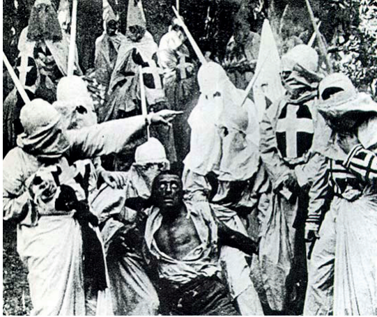
Fig. 7. Frammenti dal film muto Birth of a Nation (1915): l'ex Schiavo Gus catturato dal Kkk

di sottostare alle pretese del bruto si getta in un precipizio e muore. Quando sembra che tutto sia perduto per la brava gente del Vecchio Sud, ecco che arrivano i cavalieri del Kkk che affrontano i ribelli neri, li rimettono al loro posto, restaurano la gloria del Vecchio Sud con l'onore delle donne e la supremazia bianca 35 (fig. 7).