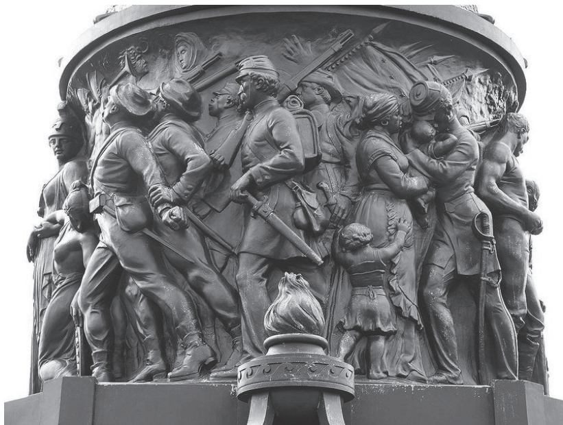
Fig. 5. Bassorilievo del monumento confederato del Confederate Memorial di Arlington

Perduta: i soldati confederati in azione, scene di vita della famiglia bianca del Sud, gli schiavi fedeli, un ufficiale che bacia il figlioletto lasciandolo nelle braccia fidate della vecchia schiava mammy (fig. 5). Sono tutte immagini in movimento: «I figli e le figlie del Sud si vedono giungere da ogni direzione. Il modo con cui affollano con entusiasmo è uno degli aspetti più rilevanti di questa opera colossale. Eccoli, rappresentanti di ogni ramo dei servizi e in abbigliamento appropriato; soldati ... marinai ... minatori ... sulla destra un fedele negro servitore che segue il suo giovane padrone» 30 .