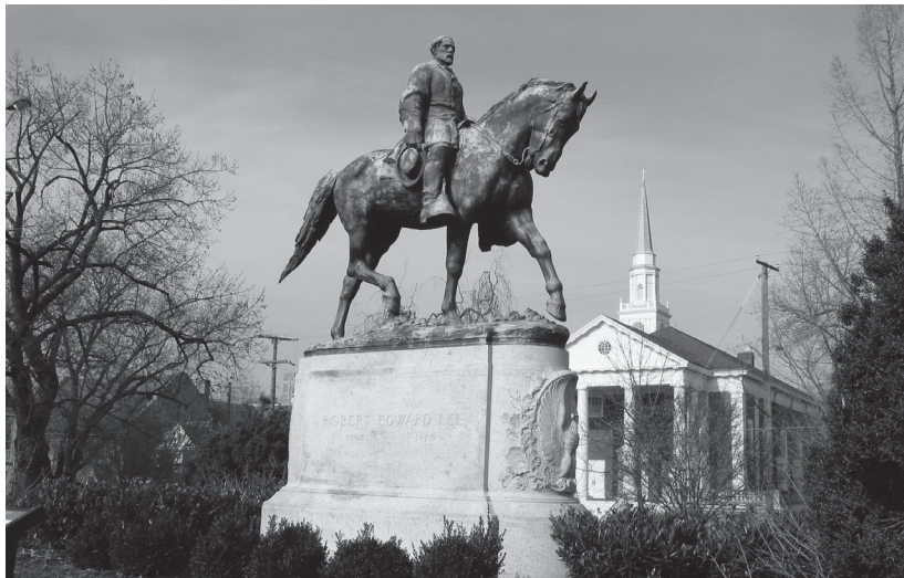
Fig. 1. Statua equestre del generale Robert Lee, Charlottesville, Università della Virginia