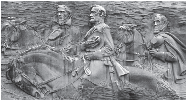
Fig. 6, 6.1, 6.2. Parco di Stone Mountain, in Georgia; cerimonia di iniziazione del Kkk (luglio 1948); le tre figure di eroi confederati scavate nella montagna