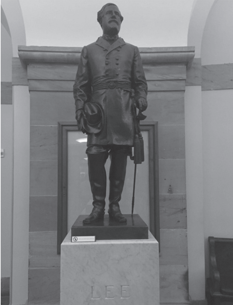
Fig. 2. Bronzo del generale Robert Lee, National Statuary Hall Collection, Washington DC

Così, nell'agosto del 1909, arrivò al Congresso un bronzo del generale Lee in uniforme confederata. Le opposizioni dei reduci continuarono ma all'ora presidente William Howard Taft, repubblicano progressista, mise fine alle critiche concludendo che non esisteva sul piano giuridico nessuna legge che potesse impedire