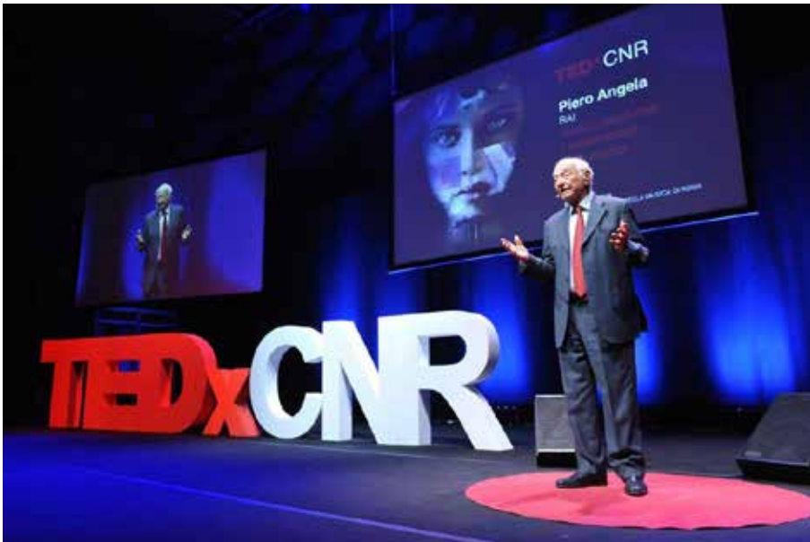
Figura 3 Piero Angela sul palco del TEDxCNR