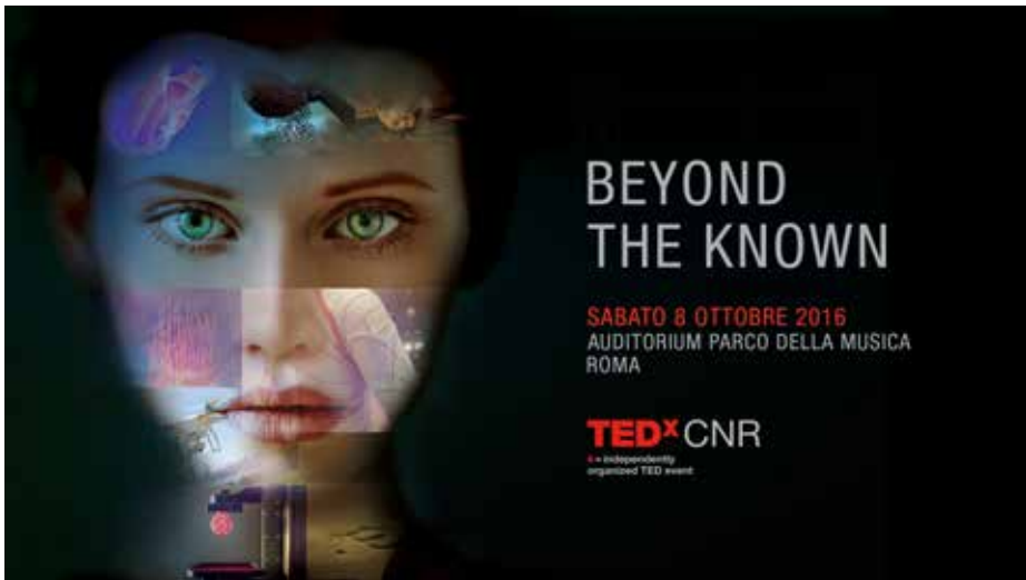
Figura 2 L'immagine del TEDxCNR "Beyond the Known"

La scelta della figura di donna ha un duplice significato: da un lato rafforza ancora di più il senso di umanità, avendo la donna facoltà di procreare, e dall'altro cerca di sfatare il mito che la scienza sia prerogativa principalmente maschile.