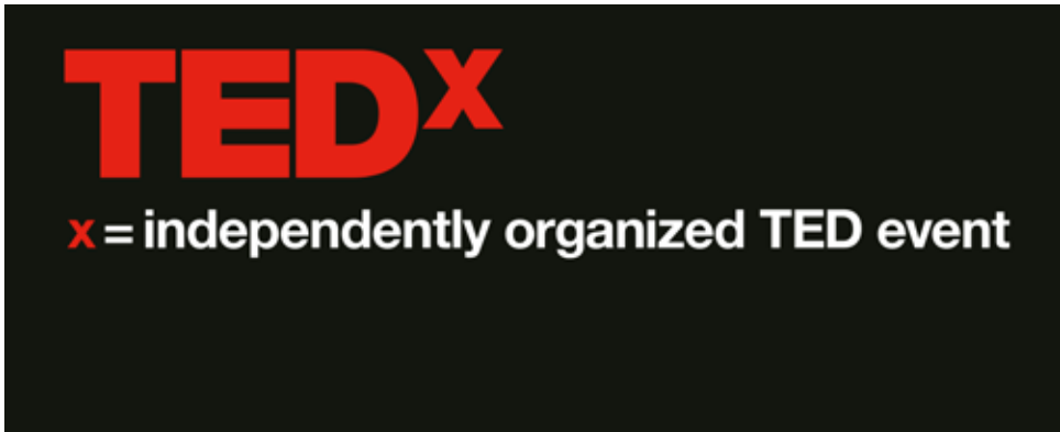
Figura 1 Logo TEDx

Sito web di riferimento: https://www.cnr.it/it/tedxcnr