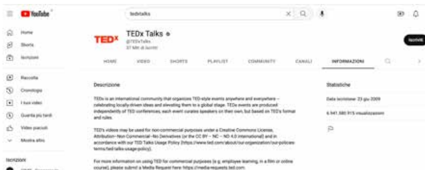
Figura 5 Youtube TEDxTalks

L'evento ha avuto circa 1200 spettatori dal vivo.