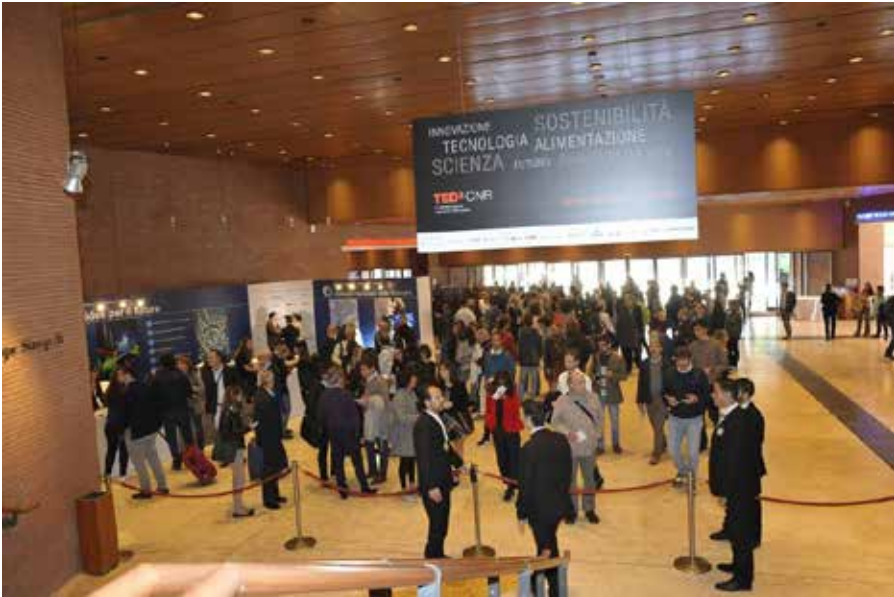
Figure 8 Foyer Auditorium Parco della Musica di Roma

Il numero dei biglietti venduti rappresenta un'ulteriore testimonianza del successo di TEDxCNR. Già diversi giorni prima dell'evento, è stato raggiunto il tutto esaurito per la sala Sinopoli dell'Auditorium Parco della Musica di Roma, che conta ben 1200 posti.