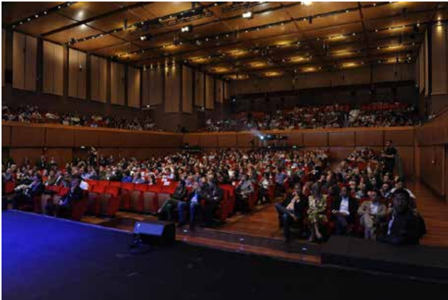
Figura 9 Sala Sinopoli al TEDxCNR

Per le modalità di svolgimento, il format TED si avvicina molto al genere televisivo più che alla classica conferenza (il CNR svolge attività di divulgazione scientifica da molti anni rivolgendosi anche al grande pubblico). Nei congressi come nelle pubblicazioni, i ricercatori sono abituati a confrontarsi con addetti ai lavori e il linguaggio usato è spesso pieno di tecnicismi. La scienza, però, deve tener conto del fatto che esiste anche un pubblico di non addetti ai lavori che vuole conoscere il mondo della ricerca, le attività e i risultati raggiunti, nonché le ricadute dei risultati della ricerca nella vita quotidiana. La divulgazione scientifica deve saper, dunque, soddisfare sempre più i bisogni informativi dei cittadini anche attraverso eventi e iniziative dal carattere innovativo come il progetto del TEDxCNR.