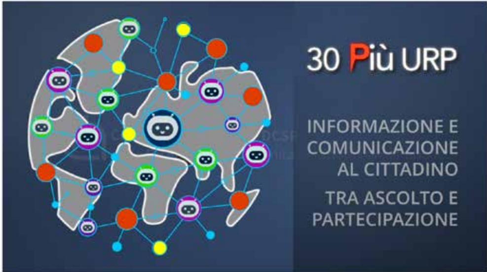
Figura 1 Video animazione presentazione evento “30 Più URP” Credits Sergio Mazza, Patrizia Principessa, Barbara Dragoni, Silvia Mattoni

L’idea di questa giornata di studi al CNR è nata dall’esigenza di approfondire alcune tematiche legate alle attività degli URP ad oltre 30 anni dalla loro istituzione, anche alla luce degli aspetti emersi dall’indagine realizzata da Sapienza Università di Roma, “30 anni di URP. La comunicazione pubblica per i cittadini tra ascolto, partecipazione e intelligenza artificiale” 2 .