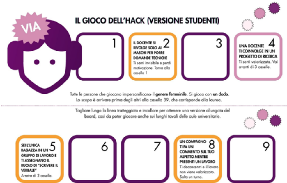
Figura 1 Il gioco dell'Hack (versione studenti): una rivisitazione dell'originale disponibile come risorsa del sito M71A (M71A, 2023)