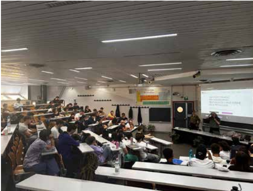
Figura 5 L'aula durante l'incontro.

Un elemento critico emerso riguarda la modalità di coinvolgimento: studenti e studentesse erano in aula perché era prevista un'attività curriculare. Si è infatti deciso di organizzare l'attività "a sorpresa", includendo l'intera classe per rispondere all'obiettivo di raggiungere il maggior numero possibile di persone. Tuttavia, anche se come si vede nella figura 5, l'aula gremita ha consentito una partecipazione attiva da parte di studenti e studentesse, la scelta non è stata gradita da tutta la platea e ha sollevato l'osservazione che sarebbe stato opportuno garantire la possibilità di non prendere parte all'iniziativa per chi non fosse stato interessato/a prima ancora che essa iniziasse.